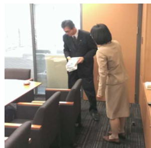
↑ 2014年5月 国会請願の様子。