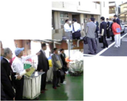
(第1部働く姿見学会の様子)

第1部は「働く姿見学会」として、日本ドリム・サービスク株式会社と就労移行支援事業所「ピカイチ」の2か所を2班に分かれて見学しました。実際に働いている様子や訓練の様子を見ていただくことで、参加企業の方にも具体的なイメージを持っていただけだと思います。