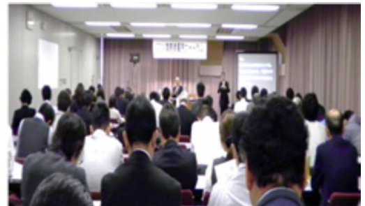
(第2部企業向けセミナーの様子)