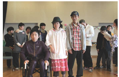
おしゃれなミス・ミスターはびきのに選ばれました！