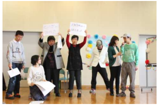
連想ゲーム 答えをどうぞ！

午後はゲストとしてS A K U R A ベリーダンス教室の皆さんに来ていただきました。ダンスと一緒に踊り大盛り上がりのなか終わりました。S A K U R A ベリーダンス教室の皆さんありがとうございました！ （柴田）