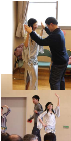
レッツ！ ダンシング♪